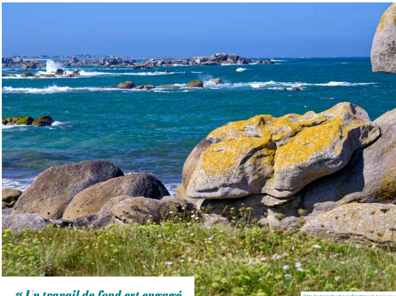
Côte des légendes dans le Finistère

« Un travail de fond est engagé avec les agences immobilières et les bailleurs afin d'encourager la remise sur le marché des locaux vacants »