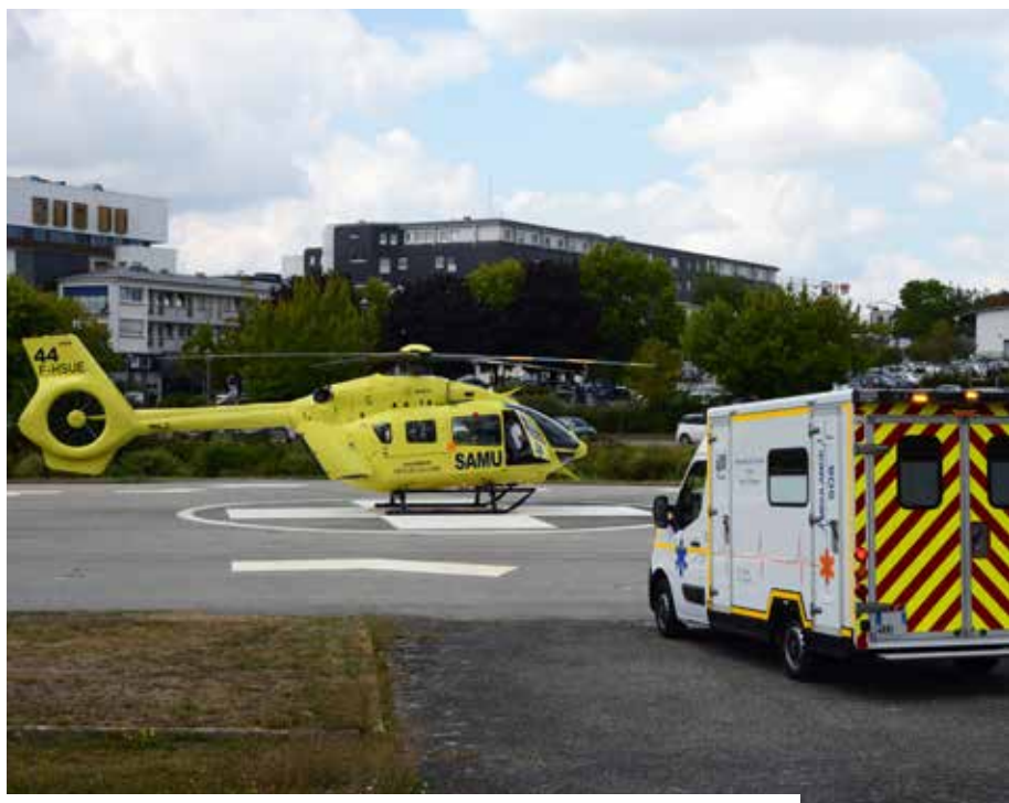
Héliport du centre hospitalier Bretagne Atlantique de Vannes le 18 août 2022

Le rôle du préfet ne se limite pas à la gestion immédiate des urgences. Il a également la charge de l'ordre public, de la sécurité et de la protection de la population, en vertu de pouvoirs de police administrative sur l'ensemble du département. Il peut mobiliser les moyens de secours des collectivités locales et réquisitionner ceux des acteurs privés pour assurer la protection des habitants.