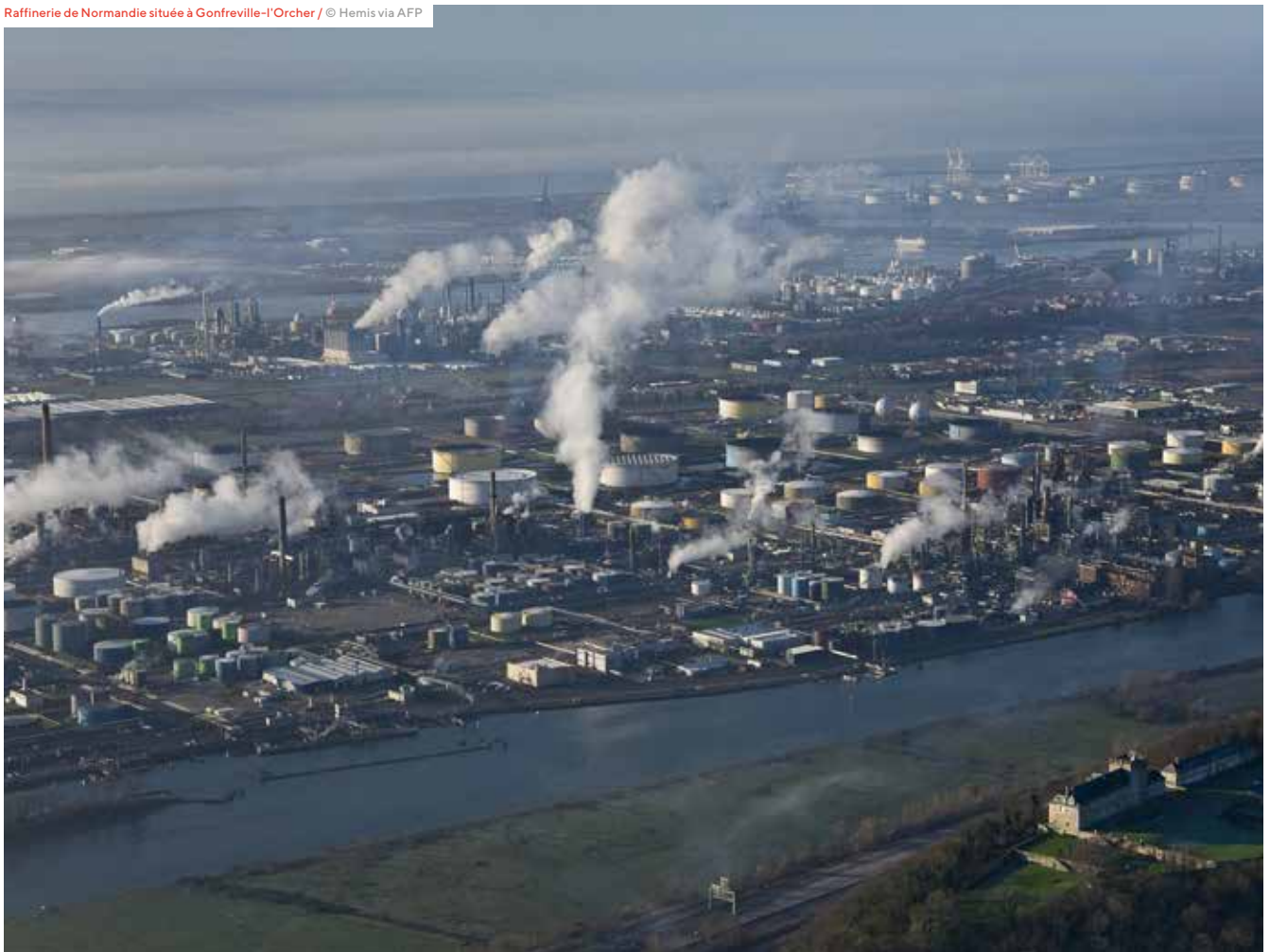
Raffinerie de Normandie située à Gonfreville-l'Orcher

Au-delà du simple déploiement de dispositifs d'alerte, CIGNALE a élargi sa portée en intégrant des acteurs publics et privés extérieurs à l'intercommunalité, tels que des lycées ou des entreprises. Cette volonté de coopération élargie entre tous les acteurs concernés par la gestion des risques majeurs constitue également