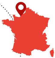
Le Havre Seine Métropole (Seine- Maritime)

DEPUIS PLUS DE VINGT ANS, LE HAVRE SEINE MÉTROPOLE ET L'OFFICE DES RISQUES MAJEURS DE L'ESTUAIRE DE LA SEINE (ORMES) DÉVELOPPENT UNE STRATÉGIE CONCERTÉE POUR PRÉVENIR ET GÉRER LES RISQUES TECHNOLOGIQUES ET NATURELS. DU DÉPLOIEMENT DU SYSTÈME D'ALERTE « CIGNALE » À LA CRÉATION DE MODÈLES HYDRODYNAMIQUES INNOVANTS, EN PASSANT PAR L'ÉLABORATION DES PLANS DE PRÉVENTION DES RISQUES TECHNOLOGIQUES ET LITTORAUX, CETTE DÉMARCHE ILLUSTRE L'IMPORTANCE D'UNE COOPÉRATION ÉTROITE ENTRE COLLECTIVITÉS, ACTEURS ÉCONOMIQUES ET INSTITUTIONS SCIENTIFIQUES POUR PROTÉGER LES HABITANTS ET LE TERRITOIRE.