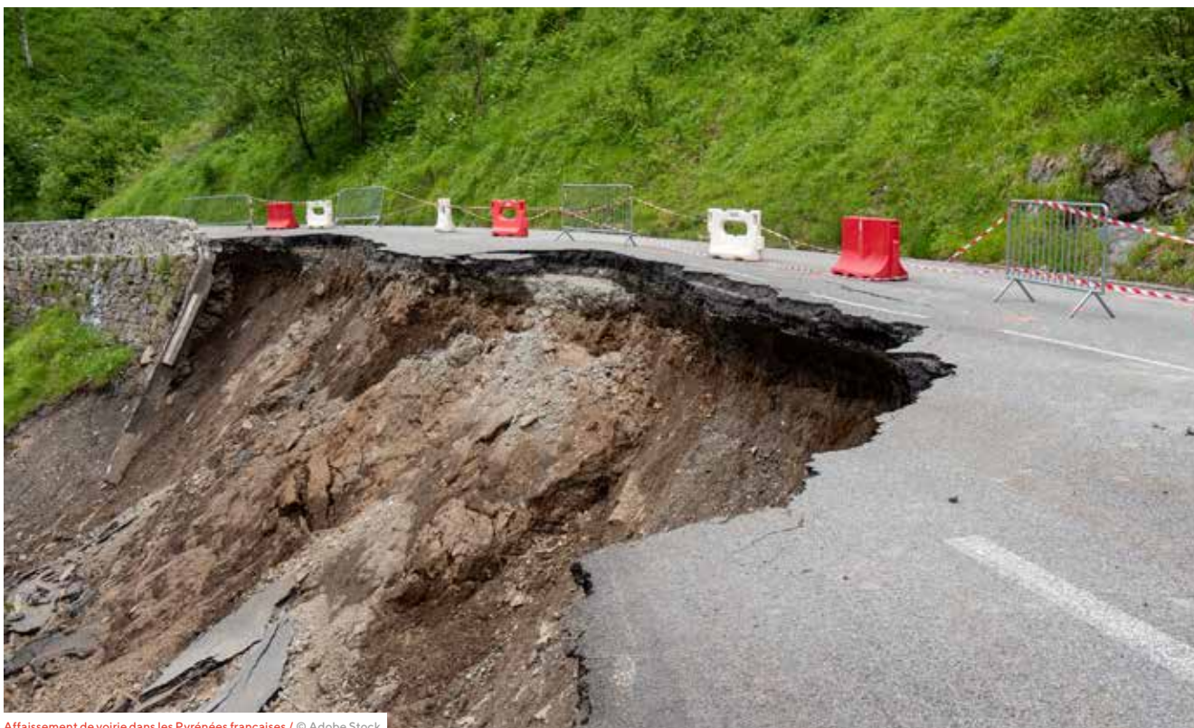
Affaissement de voirie dans les Pyrénées françaises