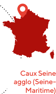
Caux Seine agglo (Seine-Maritime)

DEPUIS PLUS DE DIX ANS, CAUX SEINE AGGLO ACCOMPAGNE SES COMMUNES MEMBRES DANS LA PRÉVENTION ET LA GESTION DES RISQUES MAJEURS DONT LES RISQUES INDUSTRIELS ET NATURELS. STRUCTURÉ AUTOUR D'UN SERVICE DÉDIÉ, D'UN PLAN INTERCOMMUNAL DE SAUVEGARDE ET DE PARTENARIATS OPÉRATIONNELS, LE DISPOSITIF VISE À RENFORCER LA RÉACTIVITÉ COLLECTIVE FACE AUX SITUATIONS DE CRISE.