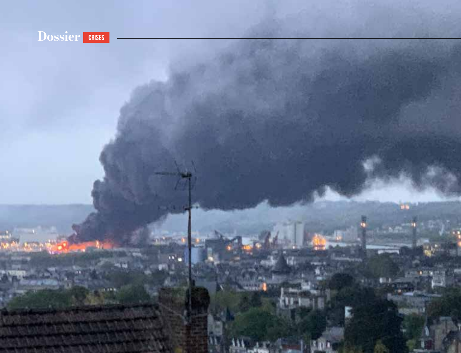
Incendie de l'usine Lubrizol à Rouen le 26 septembre 2019